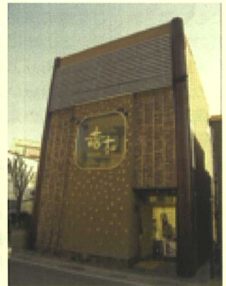
写真：駅側・裏側の外観